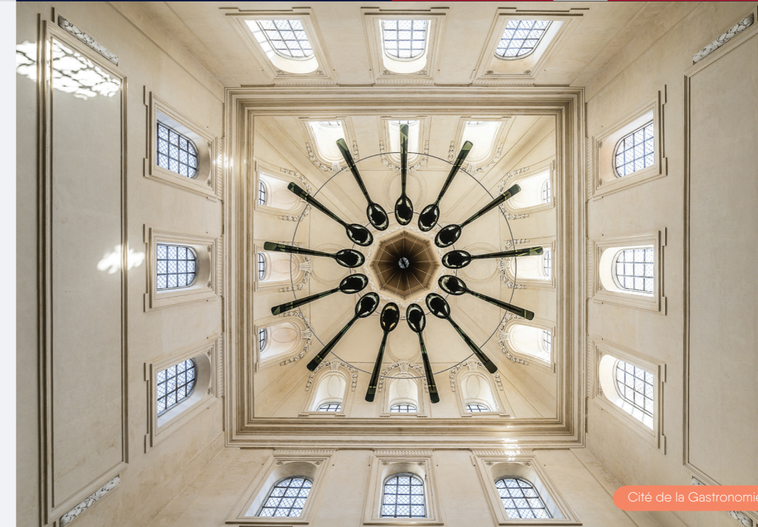
Cité de la Gastronomie