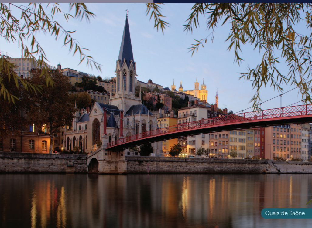
Quais de Saône